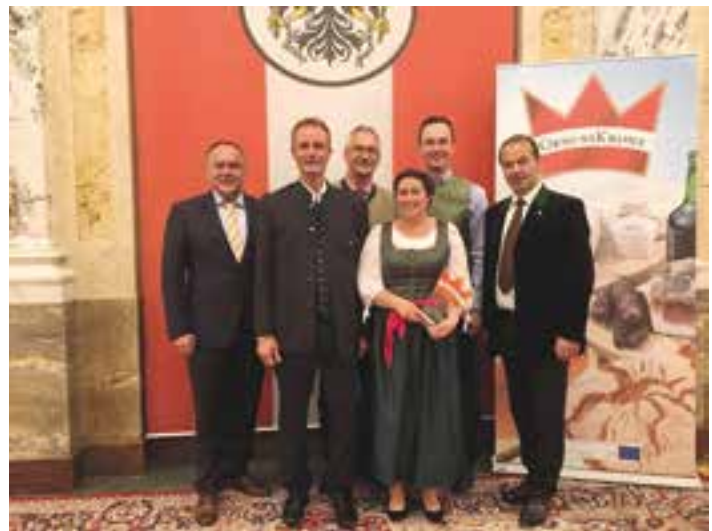
Družina Weber, Bilčovs: kategorija „nektar“ (jagodni nektar)

GenussKrone Österreich je najvišje odlikovanje za regionalne specialitete in ga oddaja vsaki dve leti društvo Agrar. Projekt Verein najboljšim kmečkim direktnim prodajalcem. Kooperacijski partnerji so med drugim Kmetijske zbornice in Agrarmarkt Austria.